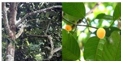
ต้นมะหาด